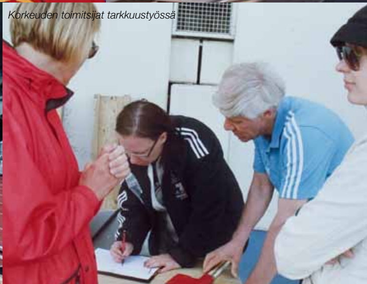
Korkeuden toimitsijat tarkkuustyössä