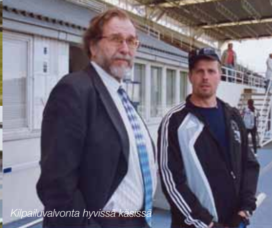
Kilpailuvalvonta hyvissä käsissä