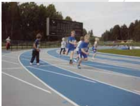
3-vaihto 4x50 m ja ylivoimaiseen voittoon ajalla 31,73!